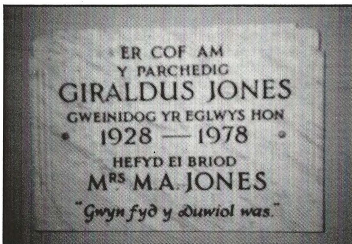
Y Maen Coffa